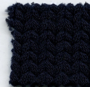
8506 ● notte